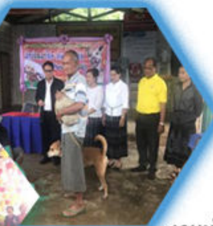
งานนโยบายและแผน อ.น.ค.ส.ท.ส่วนตำบลลือชัยสวรรค์